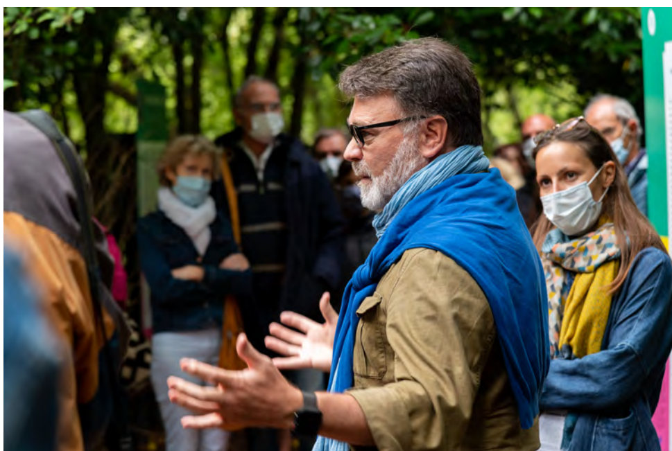
Pierre Fernandez de l'AFP en visite d'exposition Festival Photo La Gacilly 2020